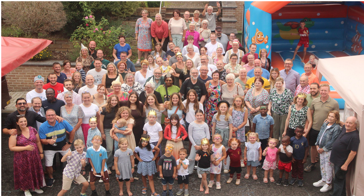
Seit 40 Jahren feiern die Driescher ihre gute Nachbarschaft.

Das Driesch-Straßenfest ist eine Institution in unserer Gemeinde. Am Samstag, 17. August, wurde das Ereignis zum 40. Mal abgehalten. Knapp 130 Personen, Groß und Klein, feierten ein weiteres Highlight in der Geschichte des ältesten Kelmiser Straßenfestes.