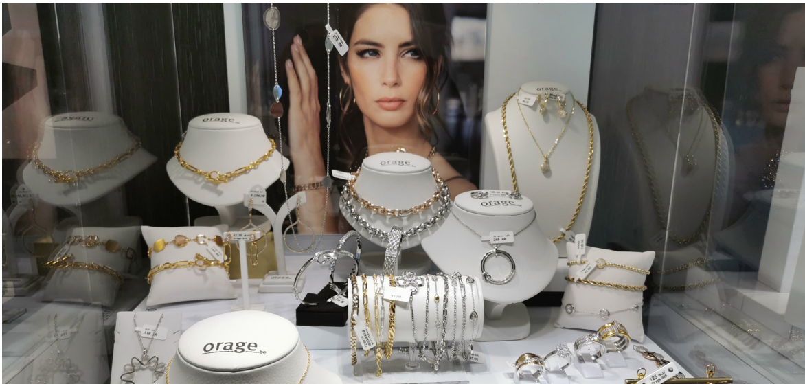
Die Bijouterie führt weltbekannte Marken wie Ice Watch, Festina, Bering, Guess, Ti Sento und Orage.

„Die Großmutter war unsere Kundin, die Mutter ist es auch. So geht das von Generation zu Generation.“