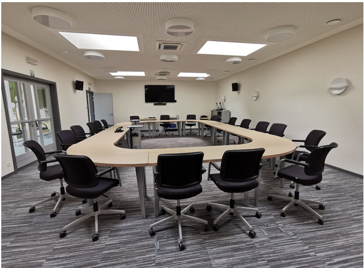
Quand les travaux de transformation à la maison communale seront terminés, les séances du conseil communal se tiendra à nouveau à la salle du conseil.

Il y a donc 21 sièges à répartir. Le bourgmestre est Luc Frank (CSP).