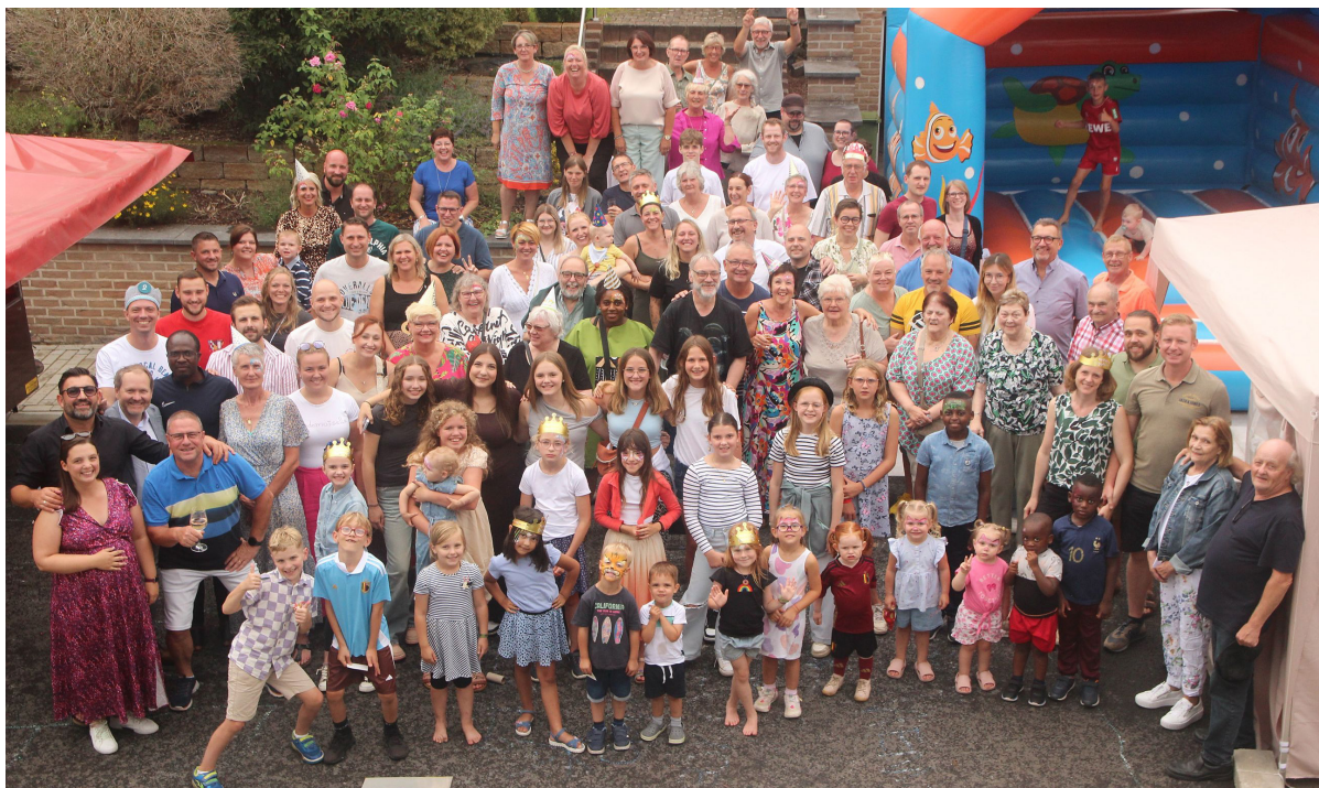
Une photo de l'édition 2024: Le 16 août 2025, les festivités de la rue du Driesch en seront à leur 41e édition.

Les festivités de la rue du Driesch sont une institution dans notre commune. Le samedi 17 août dernier, l'événement a eu lieu pour la 40e fois. Près de 130 personnes, petits et grands, ont célébré un nouveau temps fort dans l'histoire des plus anciennes festivités de rue de La Calamine.