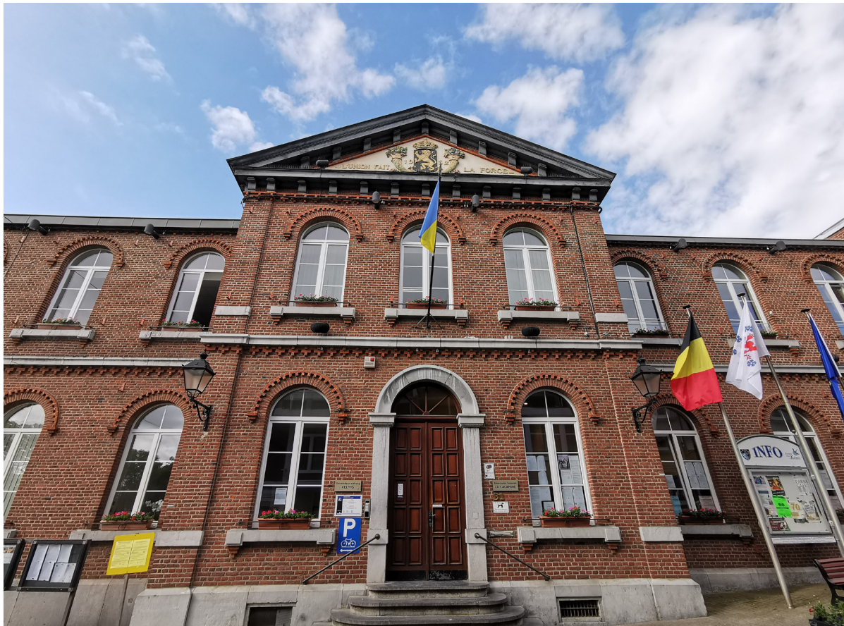
Les élections communales ont lieu tous les six ans.

Le 13 octobre 2024, les élections communales et provinciales se tiendront dans les 581 communes du pays. Dans ces deux pages, l'accent est mis sur le scrutin communal, qui a lieu tous les six ans.