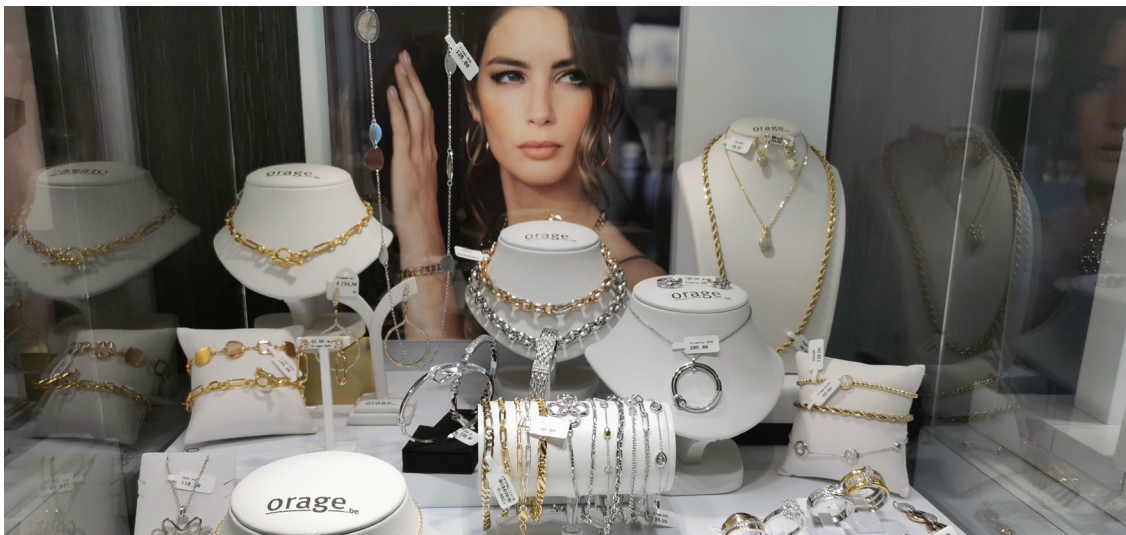
La bijouterie propose des marques mondialement connues comme Ice Watch, Festina, Bering, Guess, Ti Sento et Orage.